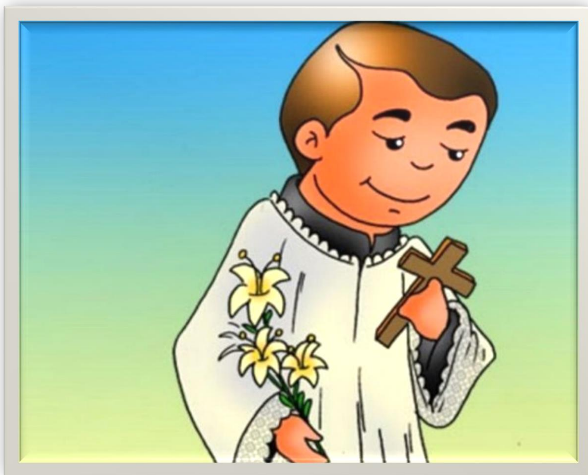
São Luís Gonzaga